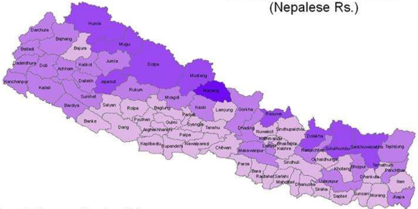
Percapita Resource (Nepalese Rs.)